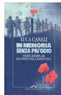
Luca Canali In memoria senza più odio: storie esemplari di uomini della Resistenza