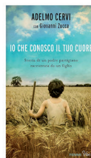
Adelmo Cervi Io che conosco il tuo cuore: storia di un padre partigiano raccontata da un figlio