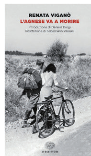
Renata Viganò L'Agnese va a morire