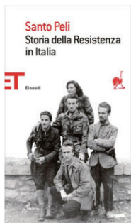
Santo Peli Storia della Resistenza in Italia